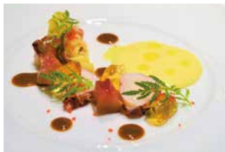
オマール海老と桃の冷製サラダ