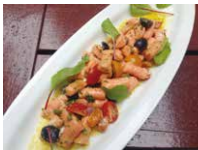
ピーツを練りこんだニョッキ プッタネスカソース