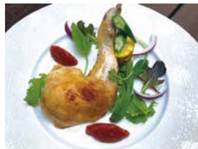
ビールによく合う鶏モモ肉のコンフィ 夏野菜のリゾット添え